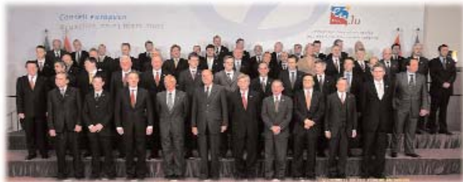
Reuniunea [efilor de stat [i de guvern la Consiliul European din 22 - 23 martie 2005