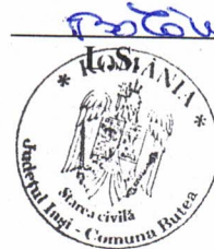
Bălăucă Ionela-Adriana Ofițer de stare civilă

Ofițer de stare civilă, Bălăucă Ionela-Adriana